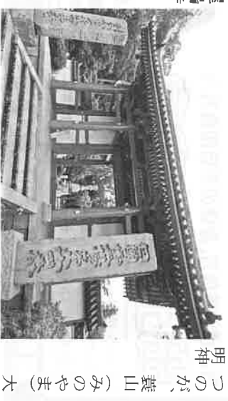
明神 つのが、養山(みのやま)大