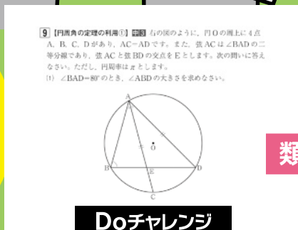
Doチャレンジ 2022年11月号